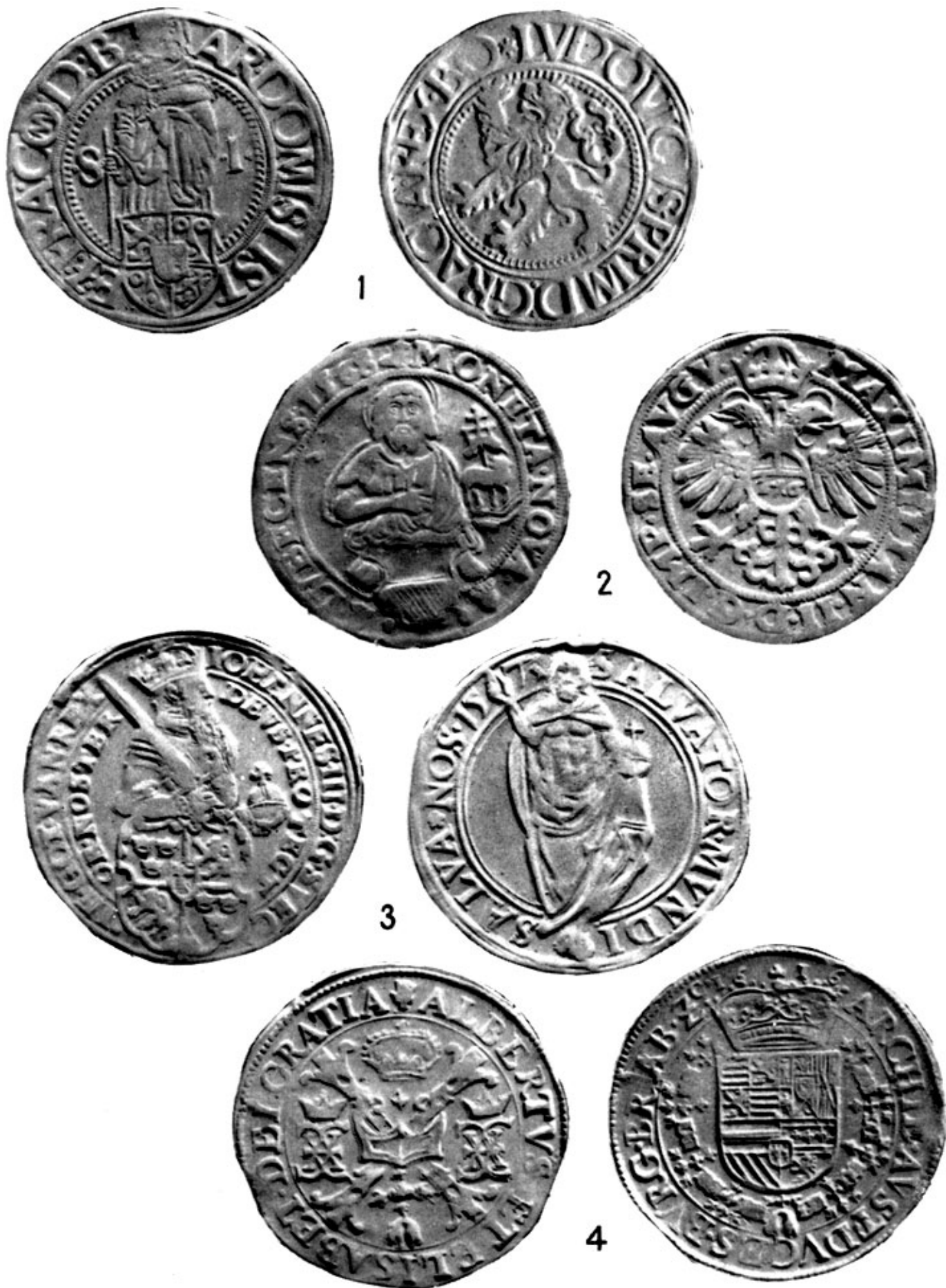
Табл. I. 1 - иоachimсталер; 2 - немецкий рейхсталер (после 1566 г.), Любек, 1568 г.; 3 - шведский риксдалер 1573 г.; 4 - патагон, Брабант, 1616 г.